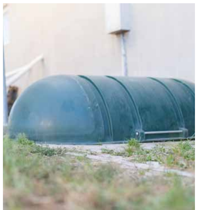
Die Tierkörper auf befestigtem Boden oder Plane und mit einer Abdeckung lagern.