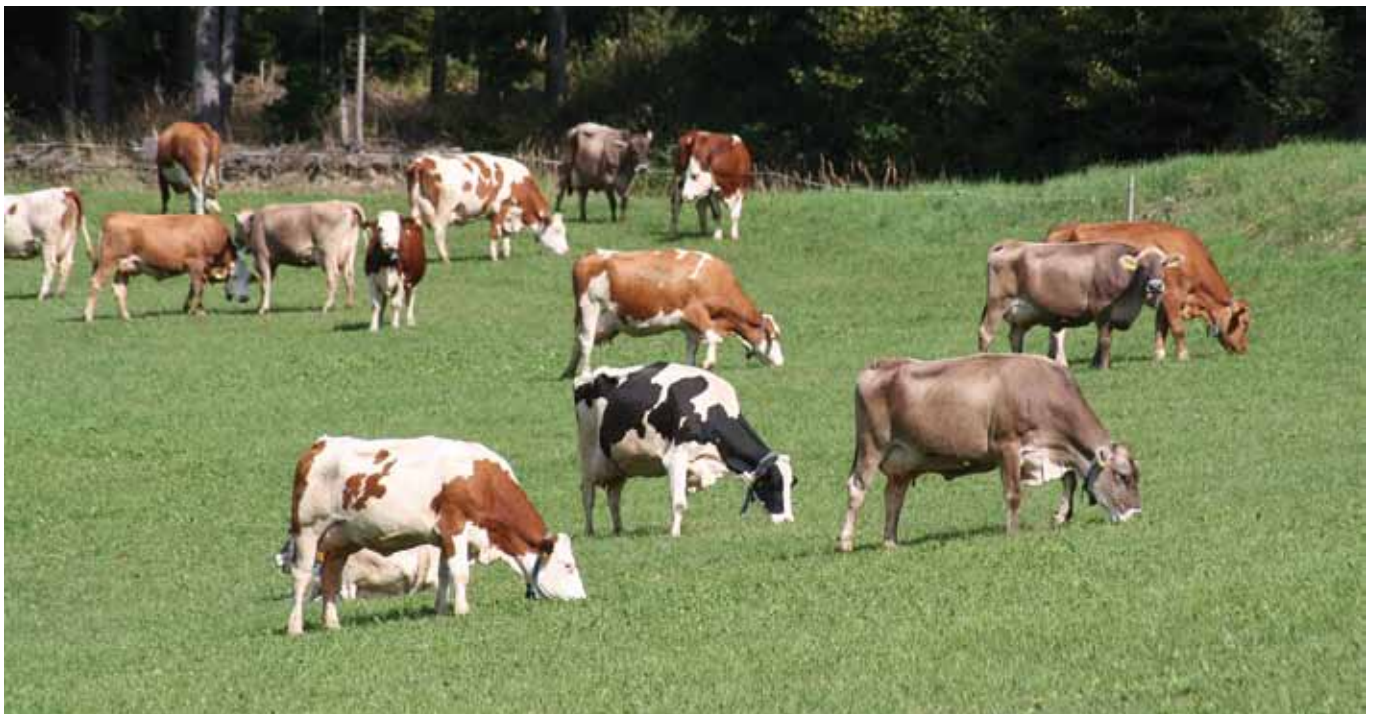
Biosicherheitsmaßnahmen sollen dazu beitragen, die eigene Herde bestmöglich gegen Krankheiten zu schützen.

Interne Biosicherheit umfasst Maßnahmen, die die Ausbreitung von Krankheiten innerhalb landwirtschaftlicher Betriebe bekämpfen.