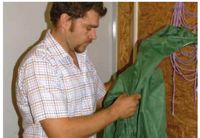
Im Quarantänebereich sind eigene Bekleidung, Stiefel und Gerätschaften zu verwenden, die nicht gleichzeitig bei der bestehenden Herde verwendet werden dürfen.