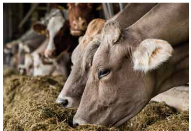
Futtermittelverschmutzungen sind unbedingt zu vermeiden. Hygienisch einwandfreie Futtermittel sind Voraussetzung für optimale Leistungen.

Die Verunreinigung der Grünflächen und in weiterer Folge der Futtermittel durch Hundekot stellt auch in Hinblick auf die Neosporose ( Neospora caninum ) ein Problem dar. Diese Infektionskrankheit bewirkt bei infizierten Kühen erhebliche Fruchtbarkeitsstörungen, wie z.B. Aborte. Zudem findet eine Übertragung der Infektionskrankheit von infizierten, trächtigen Kühen auf das ungeborene