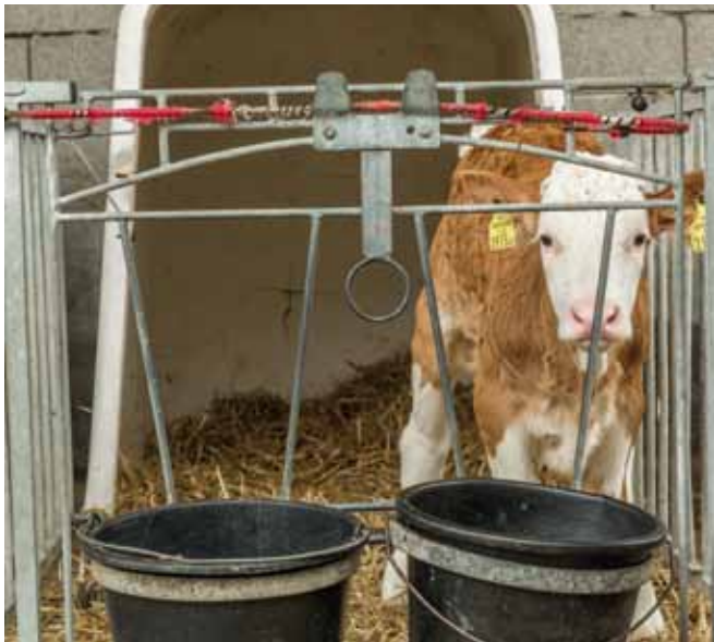
Einstreu und Futterreste, z.B. im Kälberbereich, sind mögliche Fliegenester. Daher soll die Einstreu regelmäßig erneuert, die Iglus regelmäßig gereinigt und desinfiziert werden.

Zu den wichtigsten Stallfliegenarten zählen die große Stallfliege (Stubenfliege, Musca domestica ) und der Wadenstecher ( Stomoxys calcitrans ). Sie entwickeln sich in den Ausscheidungen der Nutztiere, in Einstreu und feuchtem Futter (z.B. Silage) bzw. Futterresten. Die Sauberkeit der Stallungen stellt deshalb auch einen wichtigen Ansatzpunkt zur Bekämpfung von Fliegen dar. Wichtig ist hier das regelmäßige Ausmisten und Erneuern der Einstreu, das Entfernen von Futterresten und die Eliminierung anderer etwaiger Brutplätze.