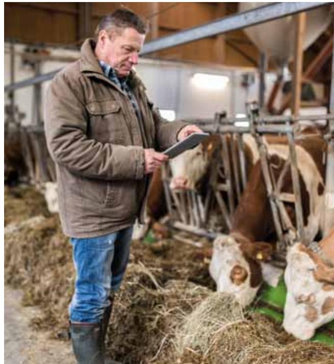
Die Erfassung und Auswertung von Produktions- und Managementdaten (z.B. aus dem Tagesbericht) lassen Rückschlüsse auf die Tiergesundheit zu.

verschiedenen Tiergruppen (Kälber, frisch abgekalbte Kühe, gesundheitlich auffällige Tiere usw.) mit entsprechender Dokumentation ist ratsam. Der Betrieb soll außerdem einer regelmäßigen tierärztlichen Betreuung mit entsprechender Gesundheitsberatung unterliegen. Bei Verdacht auf eine vorliegende Infektionskrankheit oder meldepflichtige Erkrankung ist umgehend der Tierarzt oder die Tierärztin zu kontaktieren bzw. Meldung bei der zuständigen Stelle zu erstatten.